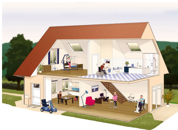
Illustration: Christian Freydank

Schlaganfall-Betroffene müssen sich orientieren und sicher bewegen können. Zudem sollte alles Wichtige in greifbarer Nähe sein, damit sie eine größtmögliche Selbstständigkeit behalten. Der Patient oder die Patientin sollte deswegen unbedingt in die Planung mit einbezogen werden, damit die Maßnahmen auf die individuellen Bedürfnisse und Einschränkungen angepasst werden können.