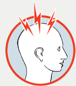
Sehr starker Kopfschmerz

Helfen Sie uns, Leben zu retten und Behinderungen zu vermeiden. Mit Ihrer Spende.