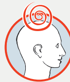
Schwindel mit Gangunsicherheit