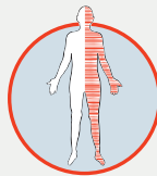
Lähmung, Taub- heitsgefühl